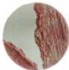
Miroir partiellement recouvert de sable. Mirror covered with sand, e 182 cm, Drift, Fernando Mastrangelo .