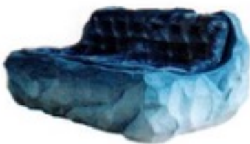
Canapé en sable coulé et velours. Cast sand and velvet sofa, L 152 x I 101 x 71 cm, Drift, Fernando Mastrangelo .