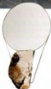
Miroir en albâtre, métal et cuir. Alabaster, metal and leather mirror, L 65 x I 42 x h 35 cm, Tension, Katharina Eisenkoeck .