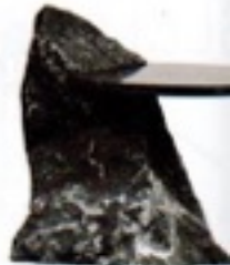
Bout de canapé en calcaire Bluestone belge et marbre. Belgian Bluestone limestone and marble side table, L 60 x h 71 cm, design Lex Pott, co-Fragments, The Future Perfect .