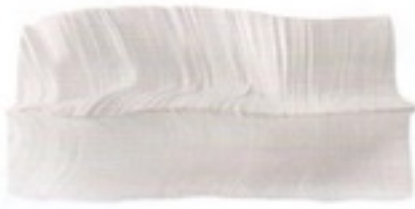
Canapé en mousse. Foam sofa, L 200 x I 55 x h 70 cm, design Martijn Rigters, Cutting Edge, Cappellini .